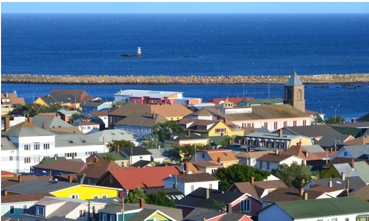
Vue générale de la ville de Saint-Pierre