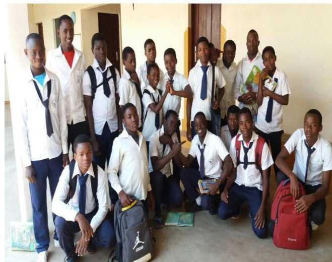
Résidents de la maison Daniel Brottier

En cherchant à répondre aux grands défis qui se posent au Mozambique et en particulier dans les zones rurales (comme Itoculo), nous avons constaté le besoin urgent d'investissements sérieux et efficaces dans le domaine de l'éducation, ce qui constitue un véritable défi ici dans notre pays. L'accès à l'école pour tous les Mozambicains est encore loin d'être une réalité; Dans les régions plus éloignées de l'arrière-pays, nous sommes confrontés à la triste réalité du manque d'écoles (en particulier dans les écoles secondaires) et dans de nombreux endroits où existent des écoles, leur niveau et leur fonctionnement sont très insatisfaisants. Cela nous a amenés à réfléchir sur le besoin urgent de créer une alternative éducative à cette structure.