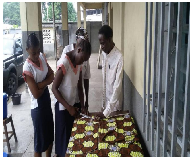
Atelier de coupe et couture