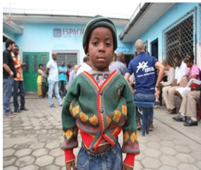
Un d'enfants accueillis à l'Espace Jarrot

1992, la congrégation des pères du Saint Esprit crée l'association des Spiritains au Congo 1997, l'ASpC, avec l'appui méthodologique d'Apprentis d'Auteuil, crée l'Espace Jarrot (Centre d'écoute) qui accueille environ 800 enfants des rues des deux sexes de 7 à 18 ans, trois fois par semaine. La gestion de l'œuvre est confiée à des laïcs. Ce sont des bienfaiteurs et généreux donateurs qui la font vivre.