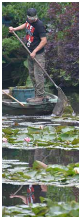
Jardin de Giverny en Normandie.

La création est bonne, très bonne, dès le commencement. C'est l'être humain qui, doté de liberté, a la capacité d'altérer cette création. Nous demandons alors à Dieu son aide pour « nous tourner vers