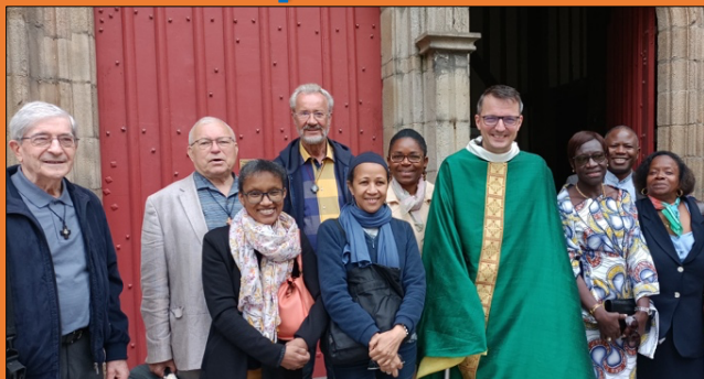
Des membres d'une Fraternité spiritaine à l'église Saint-Germain de Rennes, l'une des étapes sur les pas de Poullart des Places.

Trois samedis repartis sur les temps forts de l'année (Avent, Carême, Temps pascal), correspondant successivement à la petite enfance de Claude Poullart des Places, à sa jeunesse et maturité, à son éveil au service des pauvres.