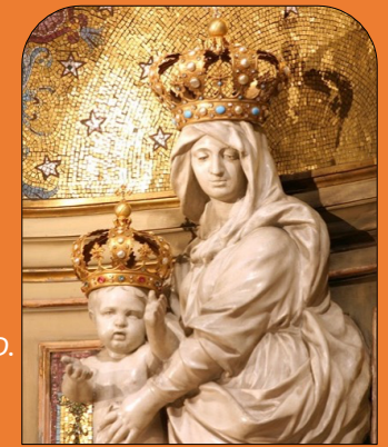
Notre-Dame des Victoires Basilique N.-D. des Victoires, Paris

Haut lieu spirituel fréquenté par Claude Poullart des Places, lieu d'éveil de son sens aigu des pauvres.