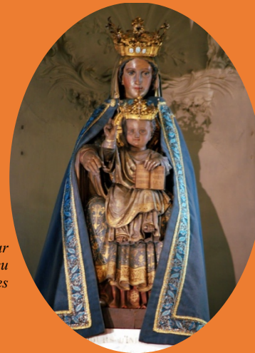
Notre-Dame des Miracles Basilique Saint-Sauveur, Rennes

Mardi 11 mars 2025 (09h) – Jeudi 13 mars 2025 (17h)