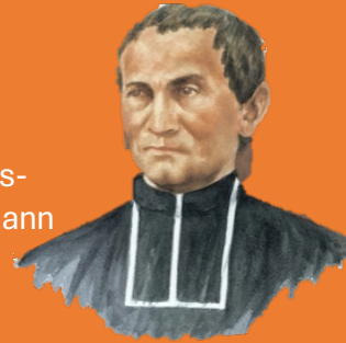
Vénérable François- Marie-Paul Libermann (1802-1852)

Mardi 11 février 2025 (09h) – Jeudi 13 février 2025